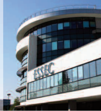
Campus de Cergy