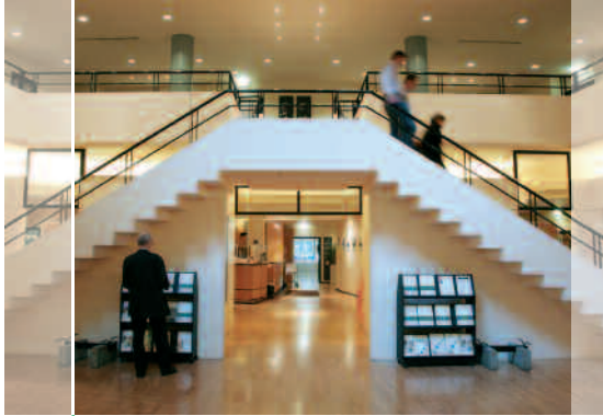
Campus de Paris-La Défense