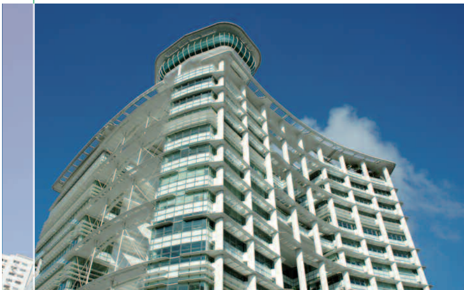
Campus de Singapour, National Library